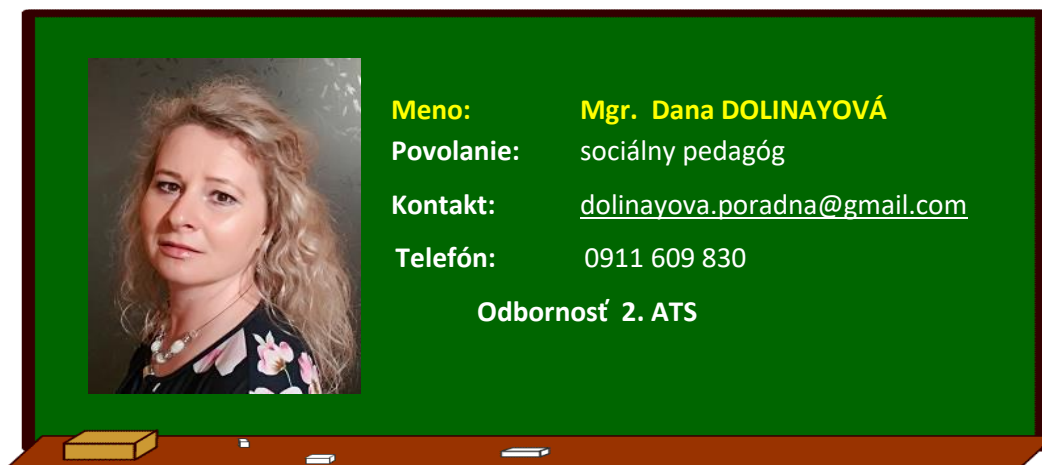
Organizačná štruktúra CPP KNM od 1.1.2023